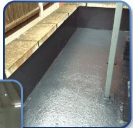
DARYARANG KNOWLEGE BASED CO.

پوشش اپوکسی نوولاک سرامیک بدون حلال با مقاومت شیمیایی و دمایی بالا و قابل اجرا برای سطوح عمودی و افقی تا ضخامت بالاتر از ۲۰۰۰ میکرون که در ۲ ظرف جداگانه رنگ و هاردنر عرضه شده است .